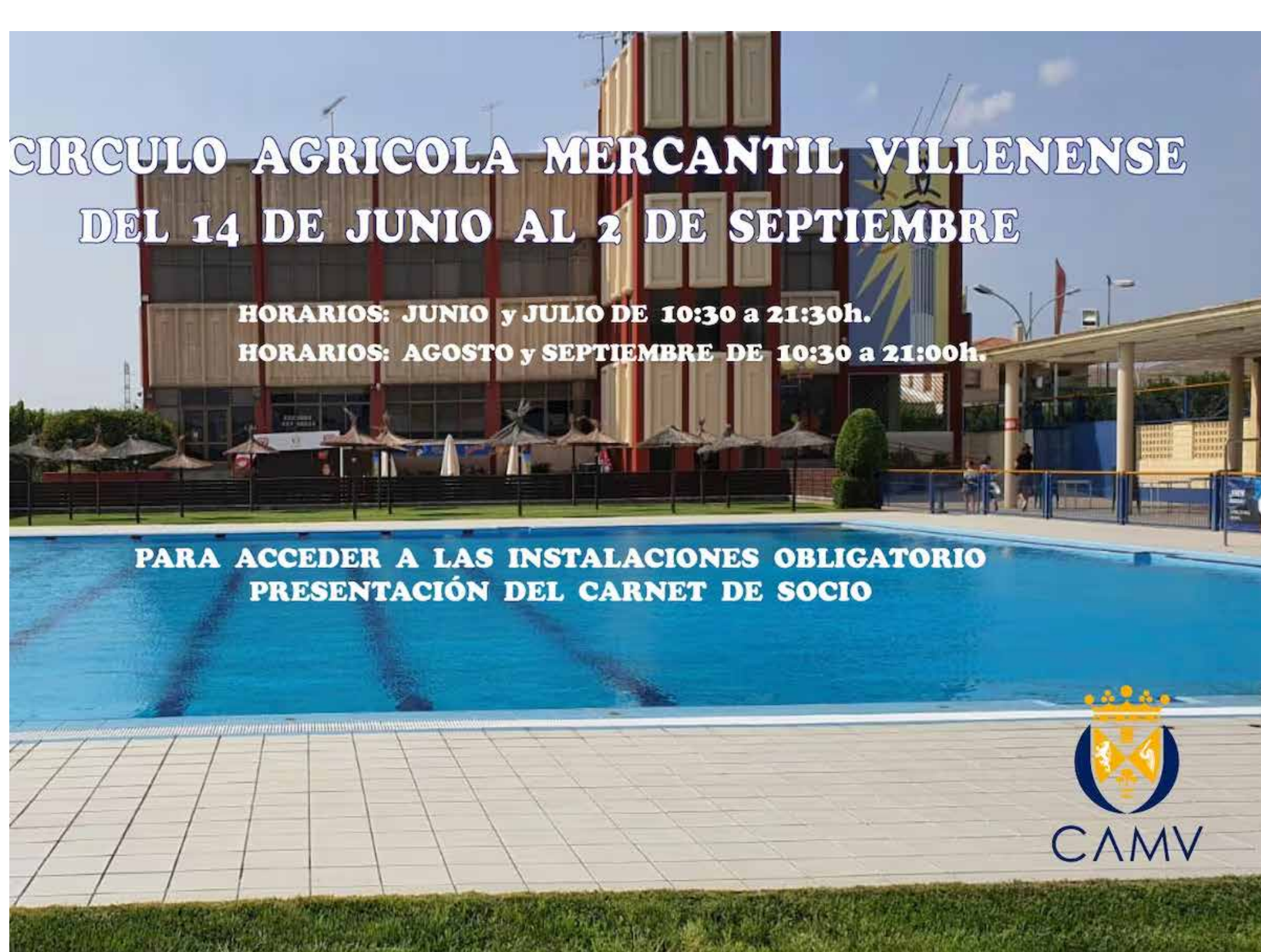
CAMV VILLENA / CAMV VILLENA

El que actualmente no existan acciones en el mercado de compraventa directamente desde el Círculo Agrícola Mercantil Villenense da prueba del buen momento que vive esta arraigada institución de nuestra Ciudad, que suma entre 2.500 y 2.600 socios, pero que da servicio aproximadamente a unas 8.000 personas.